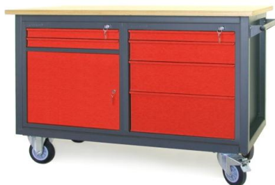
Nr kat. JK2-23-09

blat ze sklejkli liściastej 30 mm 1 szafka - S 11 1 szafka - S 12 masa: 50 kg