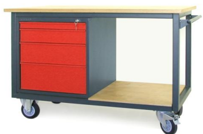
Nr kat. JK2-23-05

blat ze sklejkli liściastej 30 mm 1 szafka - S 13 masa: 145 kg