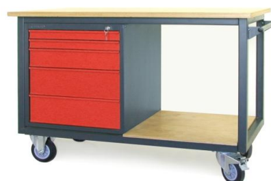
Nr kat. JK2-23-04

blat ze sklejkli liściastej 30 mm 1 szafka - S 11 masa: 82 kg