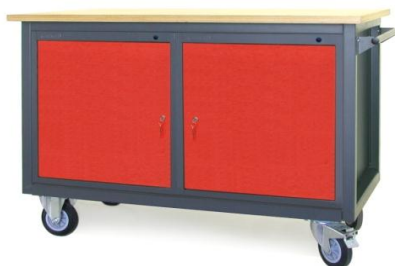
Nr kat. JK2-23-10

blat ze sklejkli liściastej 30 mm 1 szafka - S 11 1 szafka - S 14 masa: 160 kg