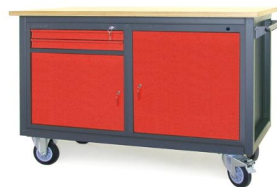
Nr kat. JK2-23-07

blat ze sklejkli liściastej 30 mm 2 szafki - S 11 masa: 80 kg