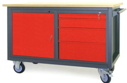
Nr kat. JK2-23-12

blat ze sklejkli liściastej 30 mm 1 szafka - S 12 1 szafka - S 13 masa: 154 kg