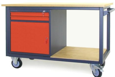
Nr kat. JK2-23-02

blat ze sklejkli liściastej 30 mm masa: 50 kg