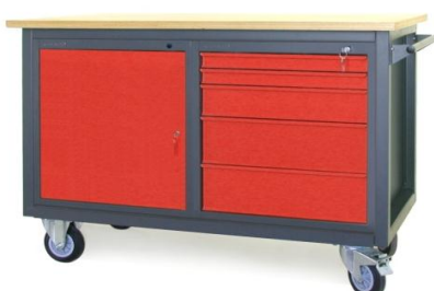
Nr kat. JK2-23-11

blat ze sklejkli liściastej 30 mm 2 szafki - S 12 masa: 152 kg