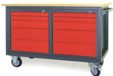
Nr kat. JK2-23-13

blat ze sklejkli liściastej 30 mm 1 szafka - S 12 1 szafka - S 14 masa: 65 kg