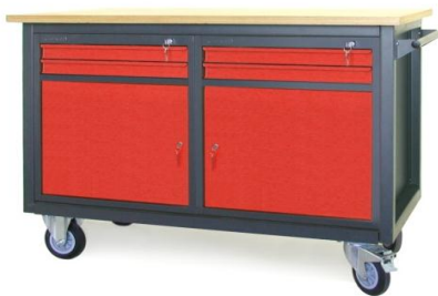
Nr kat. JK2-23-06

blat ze sklejkli liściastej 30 mm 1 szafka - S 14 masa: 79 kg