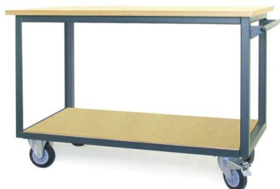
Nr kat. JK2-23-01

blat ze sklejkli liściastej 30 mm masa: 50 kg